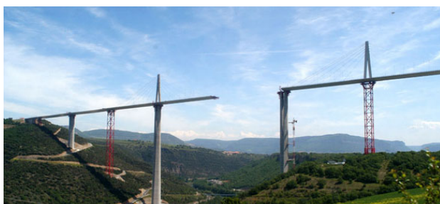
Le viaduc de Millau avant la jonction

Il est important lorsque l'on produit un document, de citer les sources de nos informations c'est à dire, citer les adresses internet des sites et le nom des livres utilisés... C'est un réflexe à acquérir.